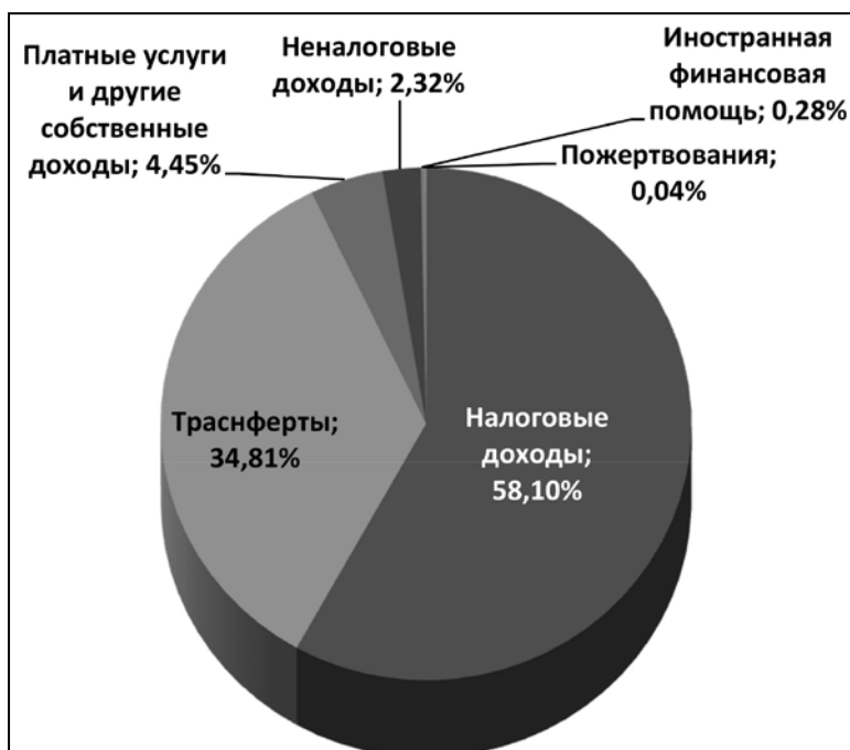
Структура доходов общего бюджета самоуправлений, % Общий доход составляет 1679,7 млн. евро