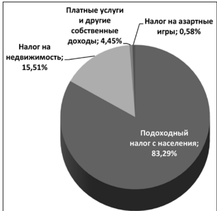
Структура налоговых доходов общего бюджета самоуправлений, % Общий налоговый доход = 975,8 млн. евро