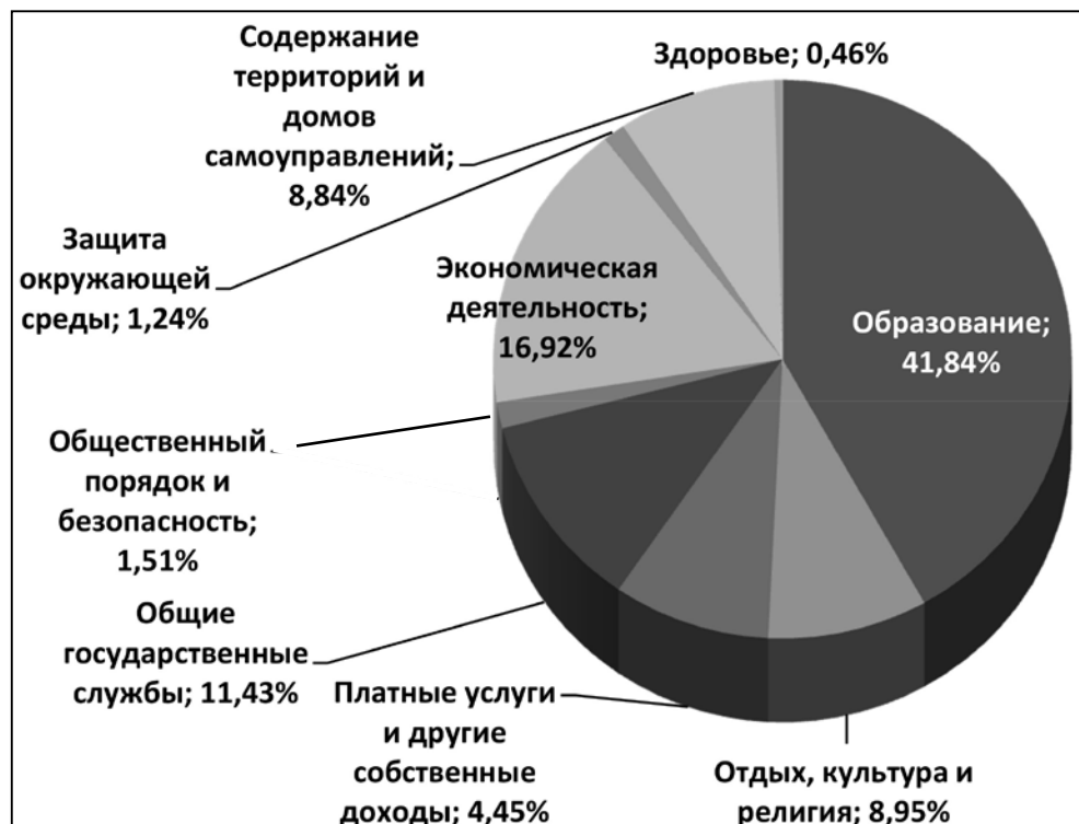
Структура расходов по функциям общего бюджета самоуправлений, %