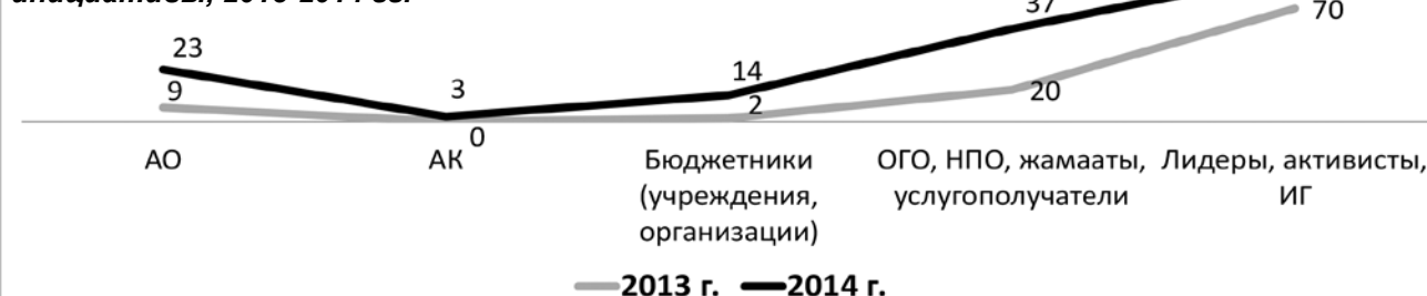
Динамика изменения источников местной инициативы, 2013-2014 гг.

Важно отметить, что инициативы не носят единовременный характер, т.к. чаще всего местная инициатива – это создание активов, вложения в инфраструктуру местных услуг, которая в дальнейшем требует содержания, регулярного финансирования поддержания физического состояния, увеличения (что часто бывает, к примеру, в случаях с дальнейшим расширением детских садов, увеличением длины очищенных каналов и т.п.). Почти каждая такая инициатива требует также обеспечения функционирования (оплата сопутствующих услуг: коммунальные услуги, оплата труда работникам новых объектов и т.п.). С этого ракурса органы МСУ можно назвать участником ВСЕХ инициатив на территориях муниципалитетов. Конкурс «Местная инициатива» также показывает рост финансирования решения вопросов местного значения в партнерстве местных сообществ с органами мест-