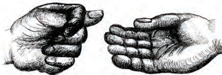
ДАЙ ВЗЯТКУ – НЕ ДАМ!