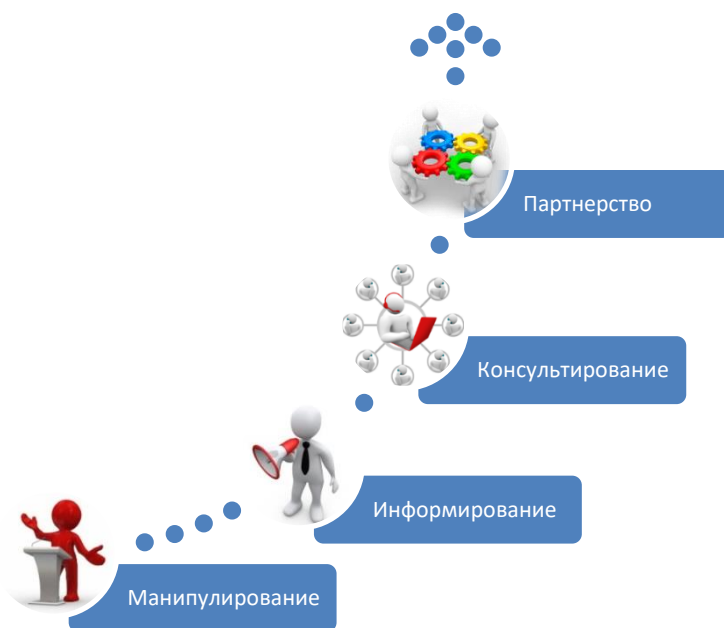
Схема 1. Ступени взаимодействия местного самоуправления с гражданами

Теория выделяет четыре ступни взаимодействия местного самоуправления с гражданами: манипулирование, информирование, консультирование, партнерство.