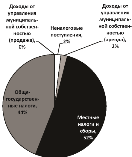
Диаграмма 1. Проект доходной части бюджета X айыл окмоту на 2015 г. (пример)

Проект доходной части бюджета на 2015 финансовый год рассчитан на базе данных по доходам, имеющихся в айыл окмоту, а также данных, полученных от государственных ведомств, таких, как районная налоговая инспекция, районное отделение Казначейства, Госрегистр, Госавтоинспекция.