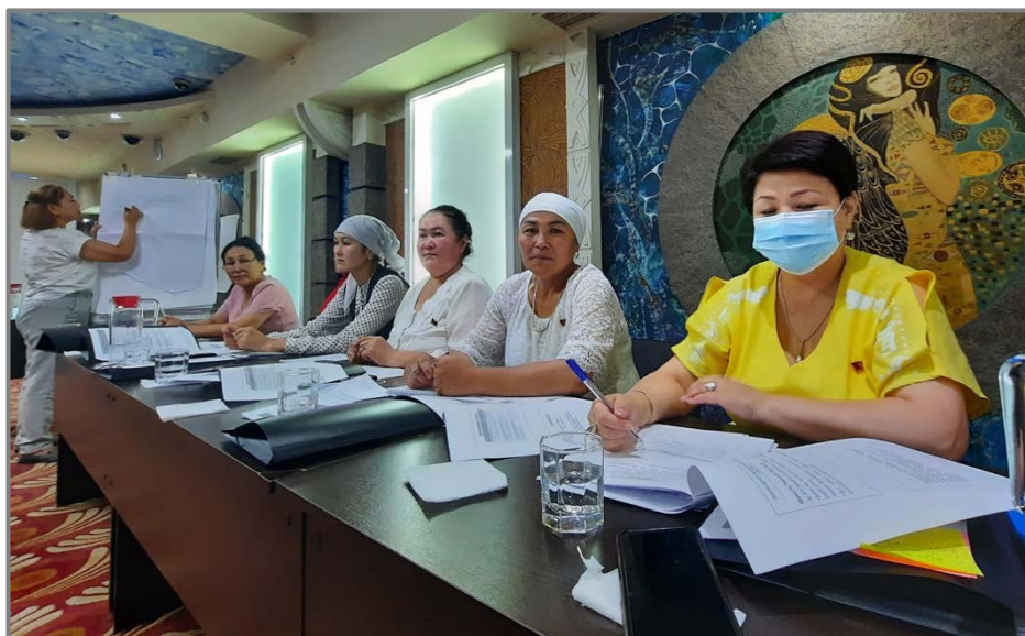
1-сүрөт: Жергиликтүү кеңештердин аял депутаттарынын 2021-жылдын июнь айында Ош областында жолугушуусу