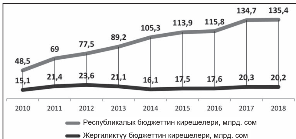
1-диаграмма. Жергиликтүү бюджеттердин кирешелеринин динамикасы, 2010-2018-жылдар.

Ошону менен бирге жыл сайын Кыргыз Республикасынын Жогорку Кеңеши тиешелүү болгон финансылык ресурстарды бербестен, жергиликтүү өз алдынча башкаруу органдарынын функцияларынын санын кеңейтип келатат. Айталы, өткөн жылдары жергиликтүү маанидеги маселелердин тизмесине туризмди өнүктүрүү, үй-бүлөлүк зомбу-