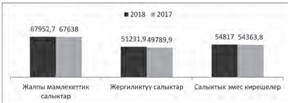
№1 диаграмма. Жергиликтүү бюджеттердин 2017-2018-ж.ж. кирешелери. (миң сом менен)

2018-жылга максаттуу муниципалитеттердин бюджеттеринин киреше бөлүктөрүндө өзгөчө өзгөрүүлөр байкалбайт. 2018-жылга өз кирешелер өткөн жылга салыштырмалуу болгону 1 пайызга көбүрөөк бекитилди. Жергиликтүү бюджеттердин киреше бөлүгүн пландоо бюджетти түзүү үчүн маанилүү болуп саналаарын белгилей кетүү керек. Кирешелерди өтө ашык болжолдоо планды аткара албай калууга, мунун натыйжасында шаардын/айылдык аймактын социалдык-экономикалык өнүгүү программасын аткарбай калууга алып келиши ыктымал. Жергиликтүү өз алдынча башкаруу органдары салыктардын, салыктык эмес кирешелердин бардык түрлөрү боюнча өзүнүн киреше потенциалын билип, кирешесин реалдуу түзүшү керек. №1 диаграмманы караңыз.