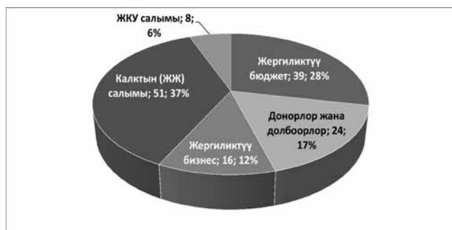
Жергиликтүү демилгелерди каржылоонун булактары (2013, 2014), %

элдин тарыхында да бар. Ар бир кыргызстандык төрөлгөндөн тарта эле “ашар” салты менен тааныш болсо керек. Анын үстүнө эксперттер бүгүнкү күндө Кыргызстанда жарандык коомдун активдүүлүгүн жогору деңгээлде баалашат.