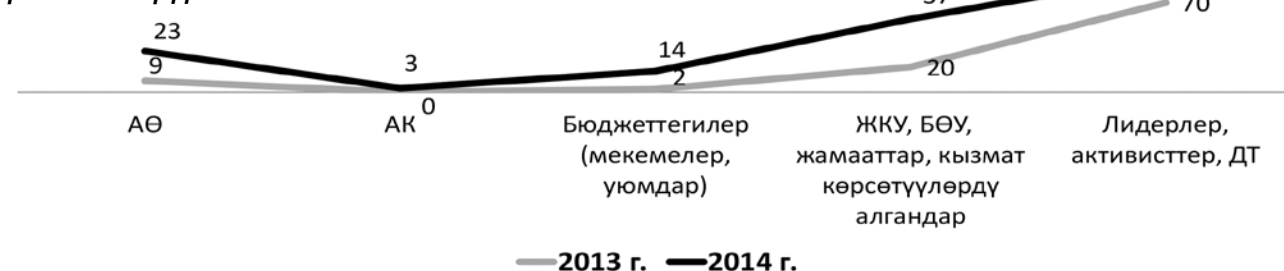
2013-2014-ж.ж. жергиликтүү демилгенин булактарынын өзгөрүү динамикасы.

Демилгелер бир жолку мүнөзгө ээ эместигин белгилей кетүү маанилүү, анткени көп учурда жергиликтүү демилге – бул активдерди түзүү, кийин жергиликтүү кызмат көрсөтүүлөрдүн инфраструктурасына акча кошууну, физикалык абалын колдоп турууга үзгүлтүксүз каржылоону, көбөйтүүнү (адатта болуп келгендей, мисалы, бала бакчаны андан ары кеңейтүү, тазаланган каналдардын узундугун көбөйтүү ж.б.) талап кылат. Дээрлик ар бир ушундай демилге иштеп турууну камсыздоону да талап кылат (тийиштүү кызмат көрсөтүүлөр үчүн акы: коммуналдык кызмат көрсөтүүлөр, жаңы объекттердин кызматкерлеринин эмгек акысын төлөө ж.б.). Бул ракурстан алганда ЖӨБ органдарын муниципалитеттердин аймагындагы БАРДЫК демилгелердин катышуучусу деп атаса болот. “Жергиликтүү демилге” сынагы ошондой эле жергиликтүү жамааттардын жергиликтүү өз алдынча башкаруу органдары менен өнөктөштүктө жергиликтүү бюджеттеги каражаттын эсебинен жергиликтүү маанидеги маселелерди чечүүнү каржылоосунда өсүштү