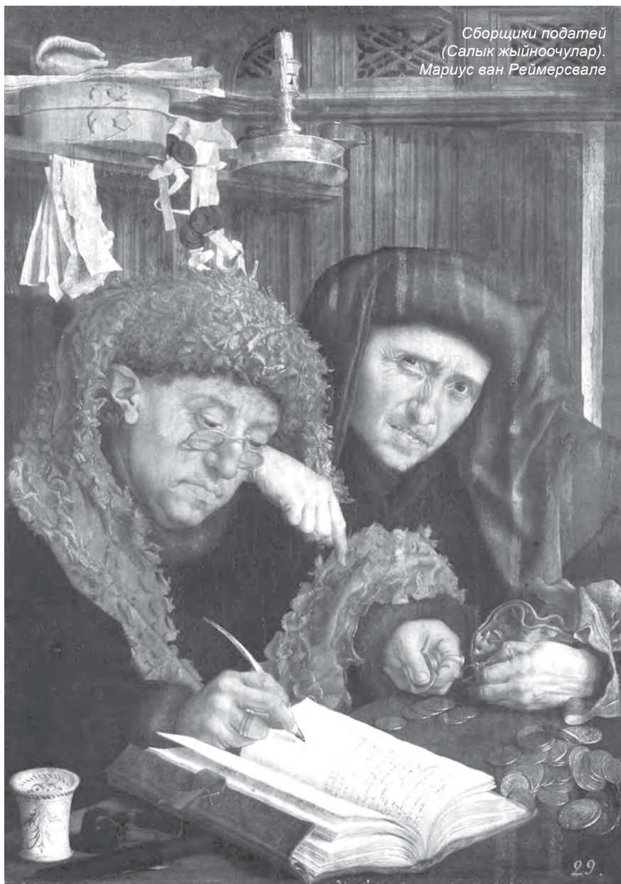
Сборщики податей (Салык жыйноочулар). Мариус ван Реймерсвале

Банк бөлүмү болбогон айылдык аймактарда гана (бардык шаарларда банктын бөлүмдөрү бар) 04 дүмүрчөгүн берүү менен акча каражаттарын кабыл алууга уруксат бар. Патенттин мөөнөтү бүтүп калганы ИСНАК базасында төмөнкүдөй болуп көрүнөрүнө көңүл буруу керек: патенттин мөөнөтү бүтөрүнө 3 күн калганда жашыл, эскертүүчү “баскыч” күйөт, мөөнөт бүткөндөн кийин кызылы күйөт. Ошондуктан маалымат өнөктүгүн өткөрүп, айыл өкмөттүн кызматкери акчаны банктын бөлүмүнө жеткиргенге