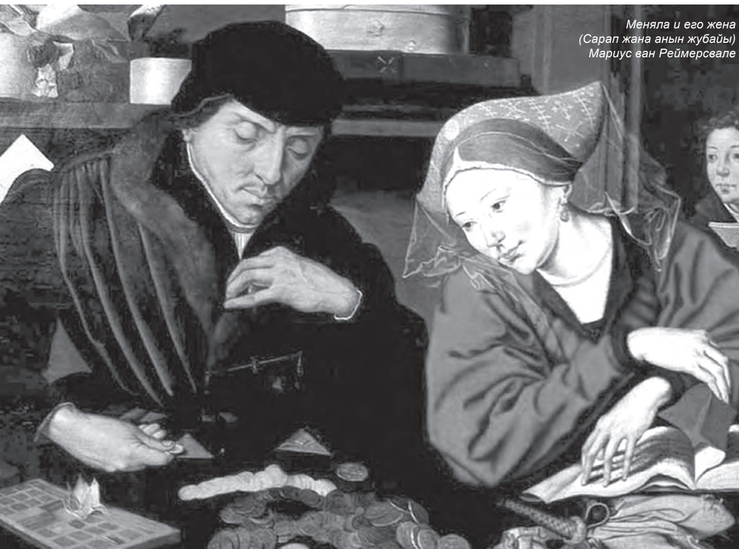
Меняла и его жена (Сарап жана анын жубайы) Мариус ван Реймерсвале