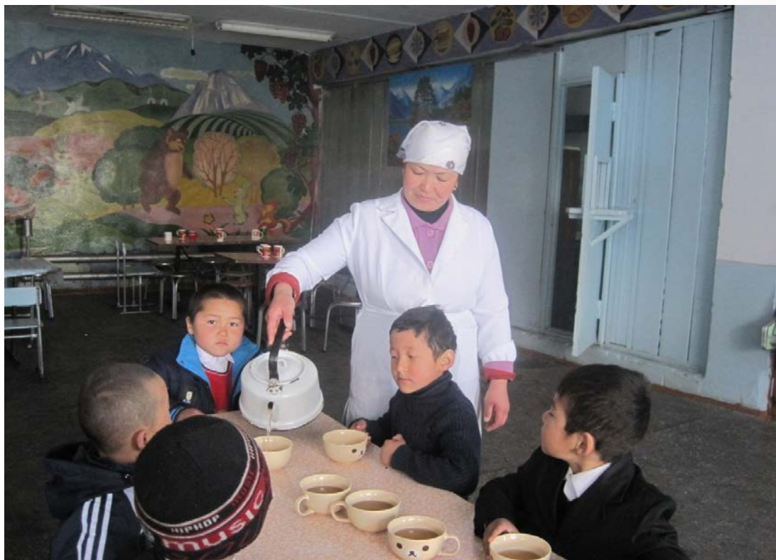
Учащиеся 1-4-х классов пьют чай

В 2011 учебном году было использовано 230176 сомов. К примеру, в апреле на 182 ученика на 22 дня было потрачено 28080 сомов.