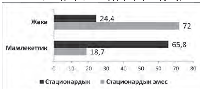
1-диаграмма. Кызмат көрсөтүүлөрдүн түрлөрү жана жеткирүүчүлөрдүн менчик формалары боюнча социалдык кызмат көрсөтүүлөрдү жеткирүүчүлөрдүн структурасы